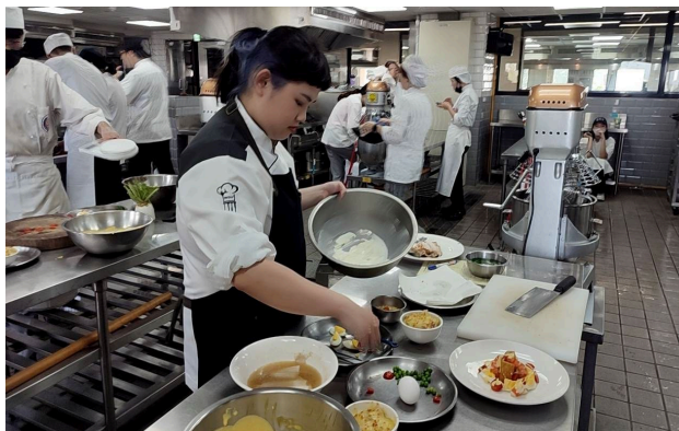
中麵丙級證照課程