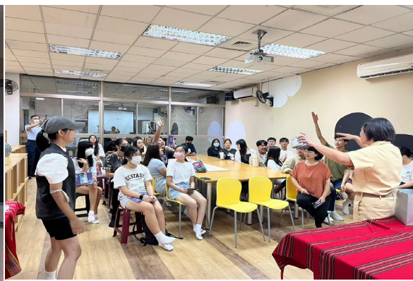
就業國軍人才-ROTC 宣導