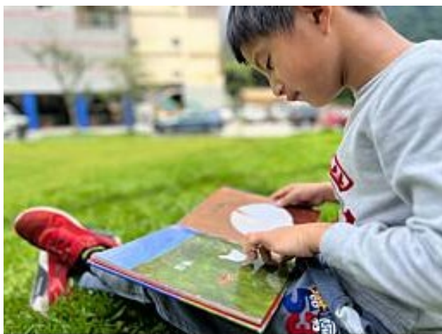
增加邏輯能力及閱讀速度