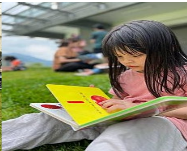
閱讀圖卡左右腦並用學習