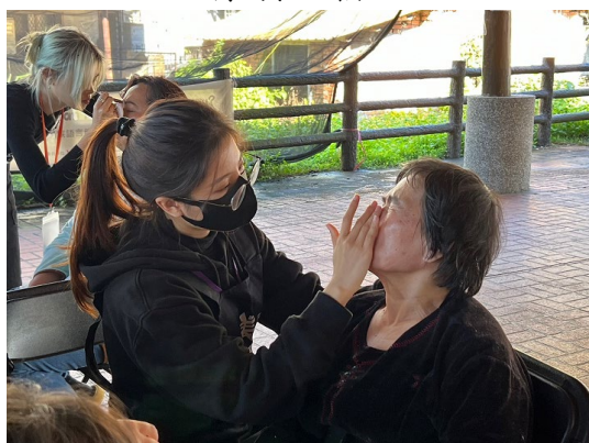
臉部按摩及護理肌膚療程