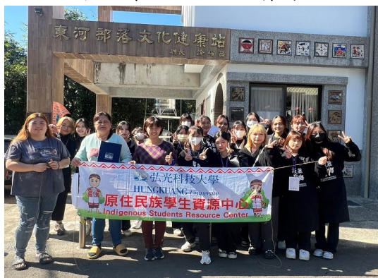
志工人員與文健站團體照