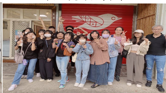
手工藝完成團體照 2