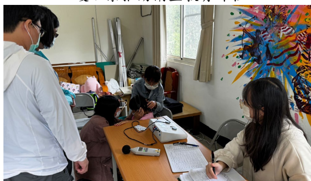
語言及聽力儀器檢測