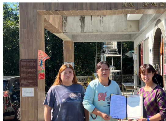
原資中心發給文健站感謝狀