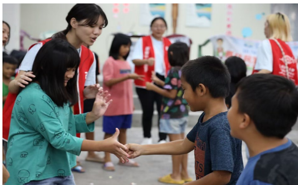
團康活動促進族人情感及團隊合作精神