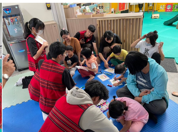
手作口腔衛生與家長共同參與