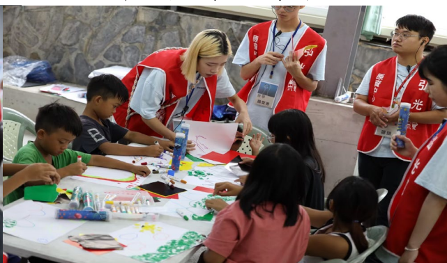
培養手眼協調能力及顏色辨識度