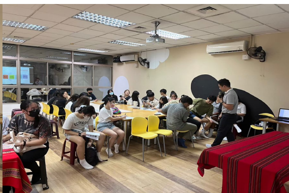
2.設計畢業職涯規畫