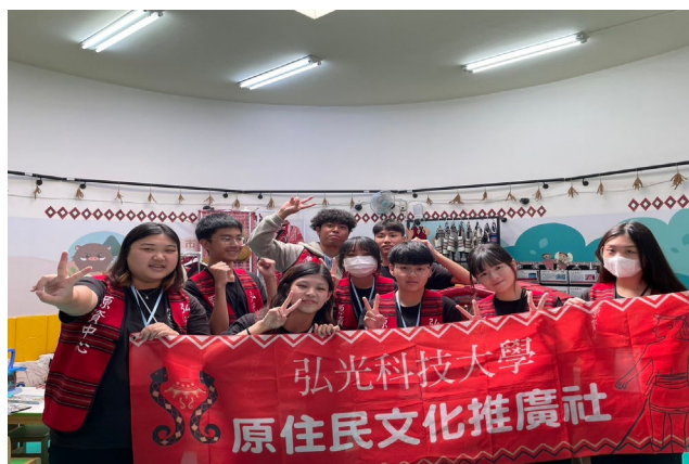
護理系推動衛生教育課程