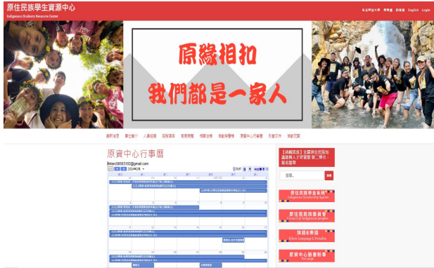
校內網頁行事曆連結