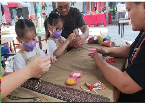
原住民文藝手工市集