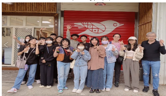
手工藝完成團體照 1