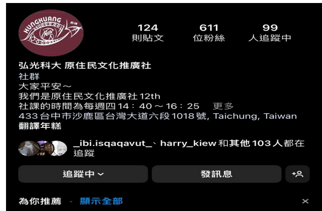
原住民族文化推廣社 IG