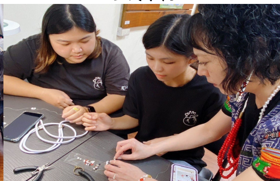
原住民老師指導教學