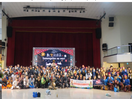
卑南族文化跨校交流活動