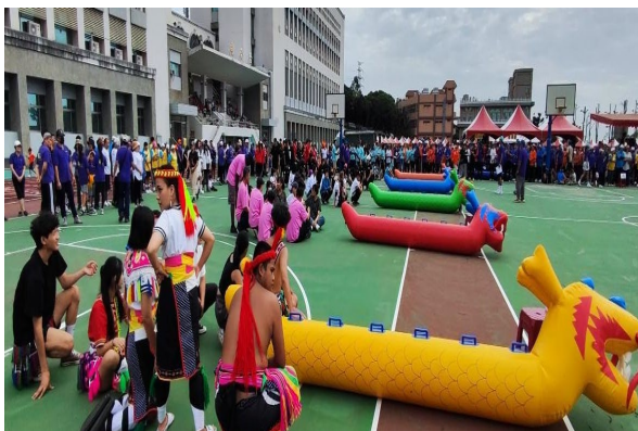
原住民族文化交流運動會