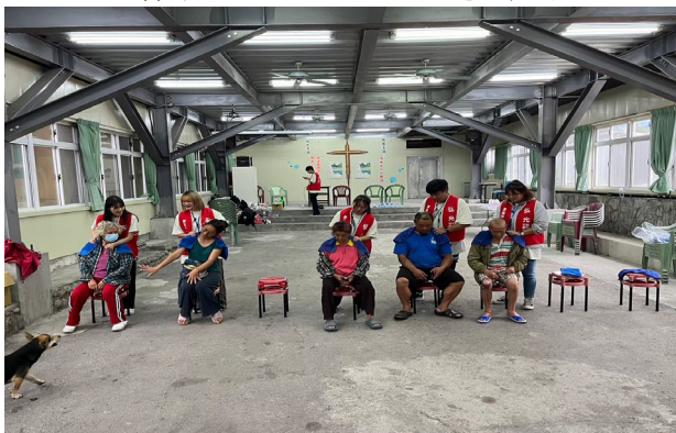
回饋族人工作辛勞