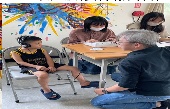
語聽系老師輔導聽力儀器檢測