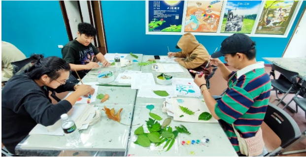
卑南文化文藝手工

2. 112.10.28-10.29 辦理部落祭典文化體驗-台東縣卑南鄉下賓朗部落，共計 20 人次，活動滿意度 100%。