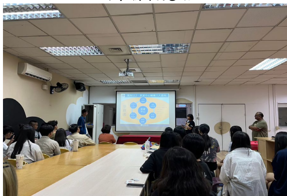
原資中心輔導機制