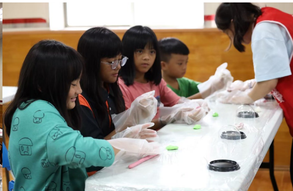
帶動中小學翻糖製作