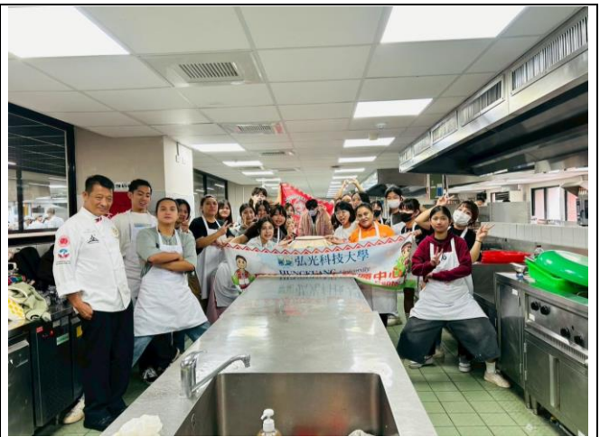
原住民族飲食文化推廣小米釀