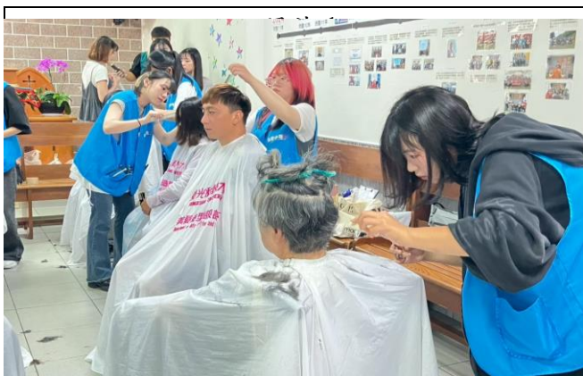
臺南歸農長老教會-義剪服務(美髮系)