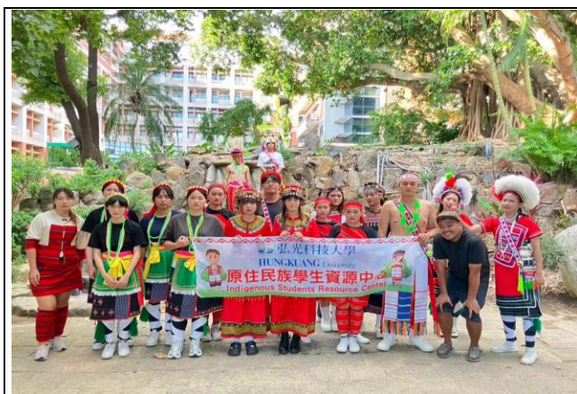
原住民族服文化體驗活動