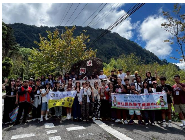
阿里山部落參訪暨族群交流會全體大合照