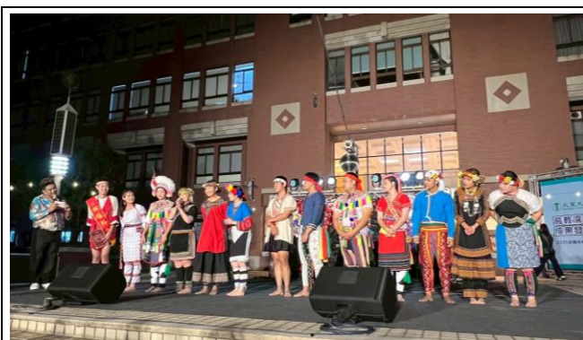
跨校樂舞交流-大葉大學