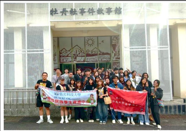
部落文化踏查-牡丹社事件故事館