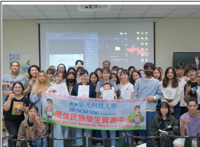
職涯工作坊全體大合照