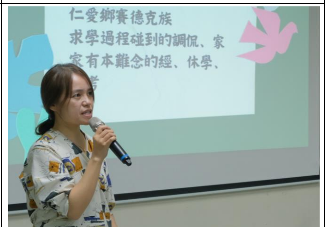
賽德克族講師-生技公司分享