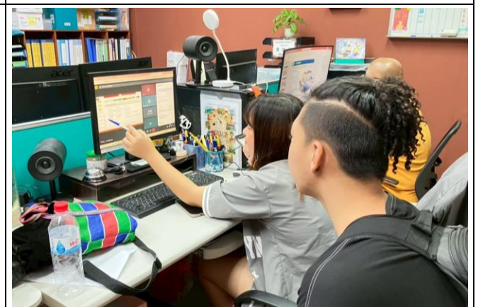
雅美語(初、中級)線上課程