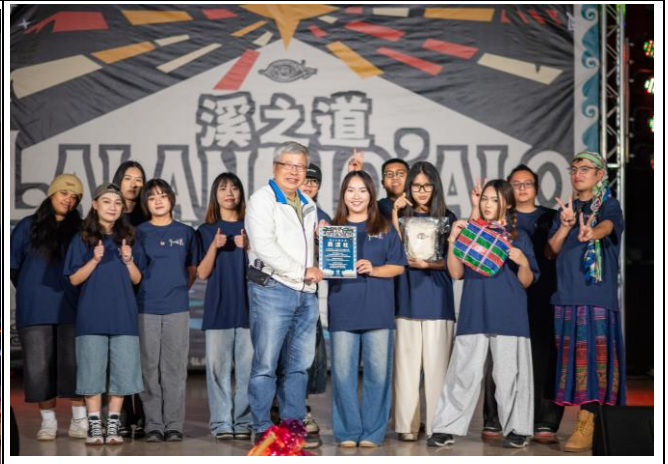
頒發感謝狀至各校表演人員