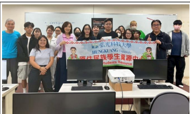
輔導 AI 考照課程大合照