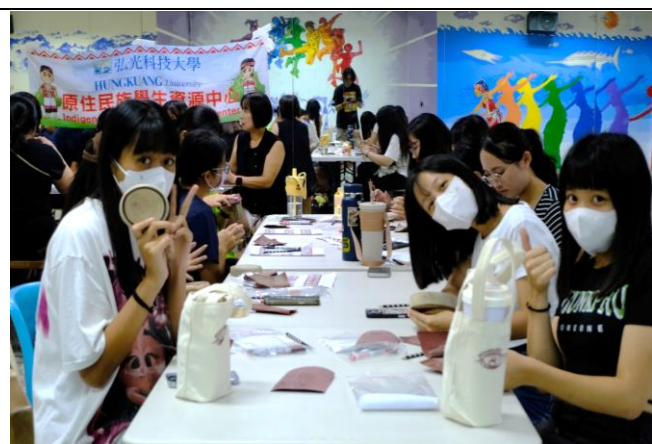
排灣木雕彩繪杯墊