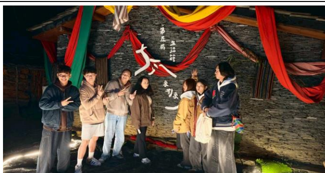
跨校樂舞交流-暨南大學