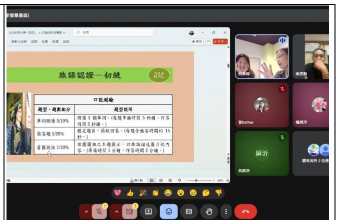
排灣語(初、中級)線上課程