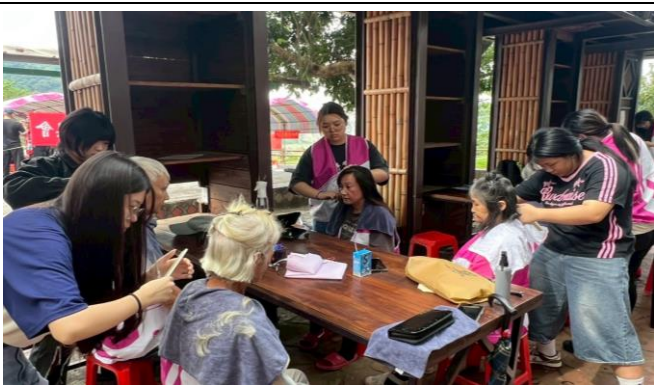
雙崎部落社區活動中心-義剪服務(美髮系)