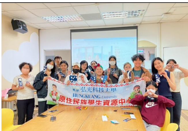
織染・植感：走進原民色彩與植物的世界