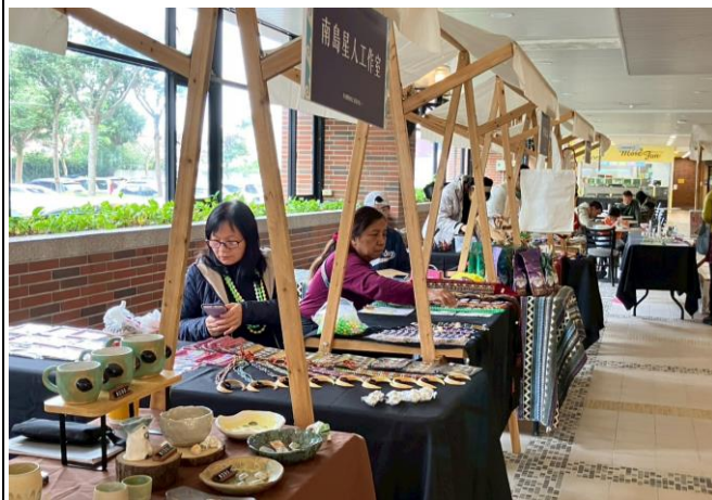
半山腰的約定-部落市集(一)