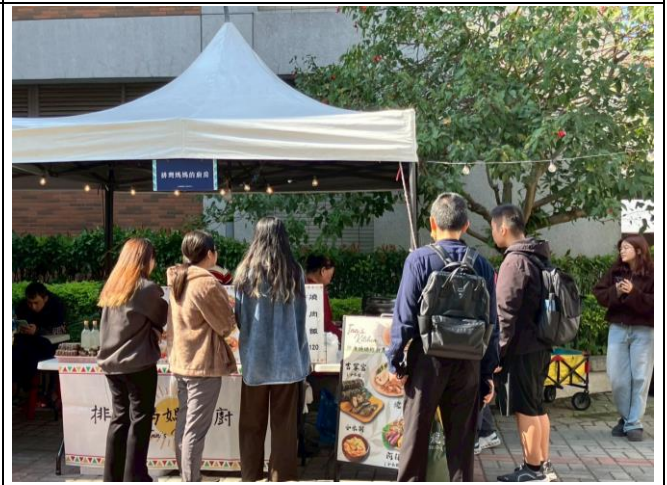
半山腰的約定-部落市集(二)