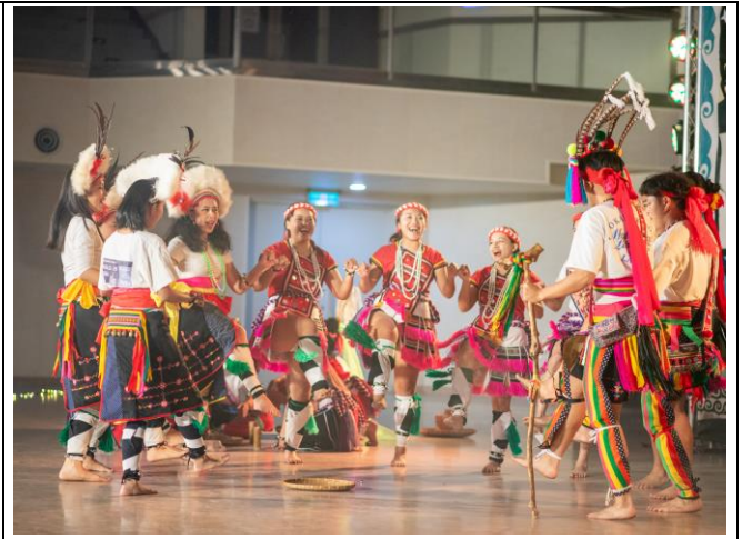
原住民族文化推廣社演出