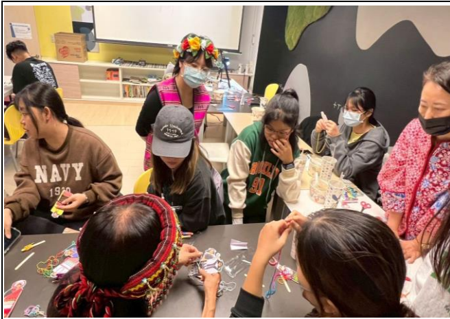
紙雕與板曆的故事