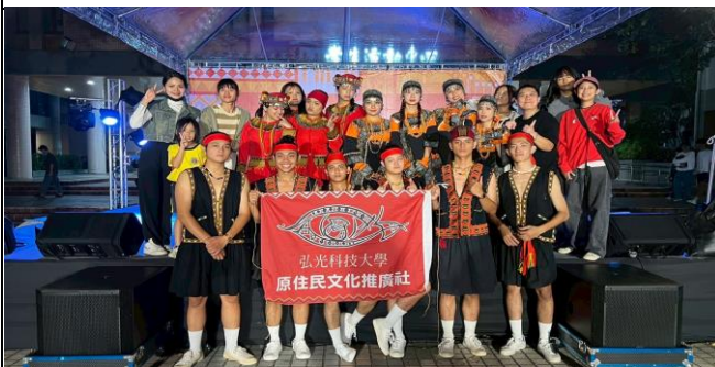
跨校樂舞交流-彰師大