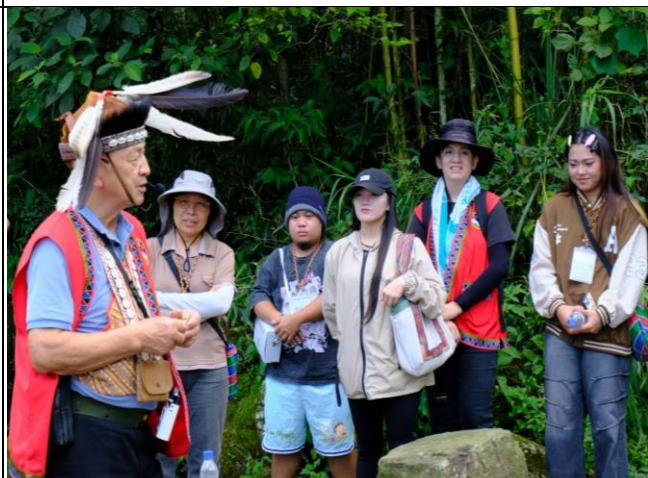
阿里山部落參訪暨族群交流會