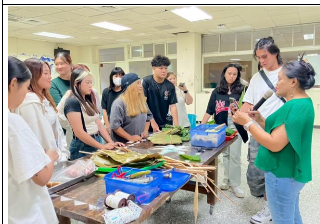
從手心到味蕾-Cinavu 好食光