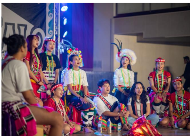
原住民族文化推廣社演出