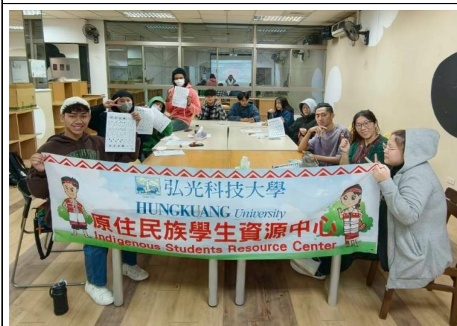
自我認同諮商輔導課：原來，我很好