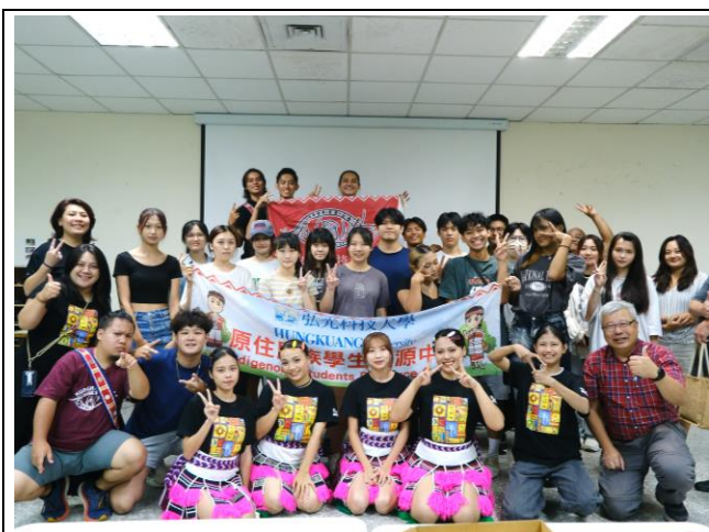
初聚原心活動全體大合照