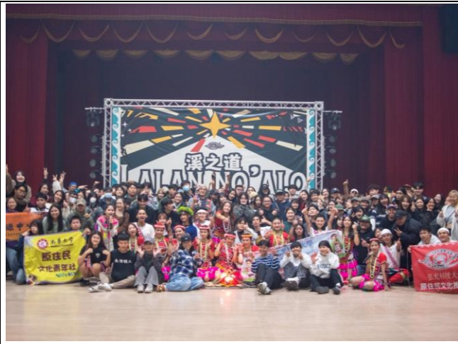
lalan no alo 溪之道全體大合照