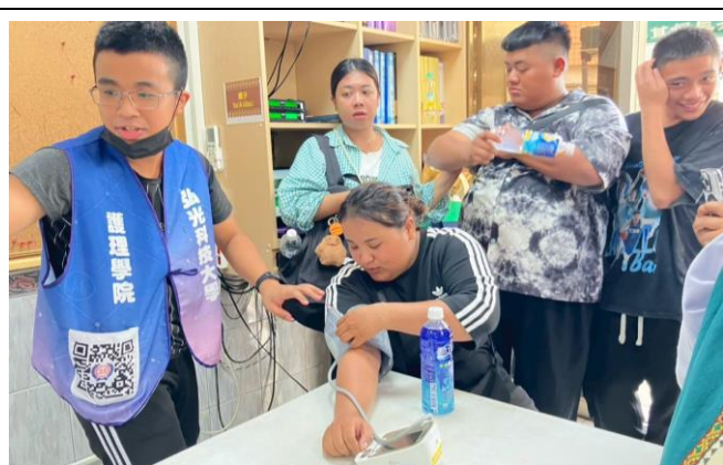
臺南歸農長老教會-義診服務(護理系)