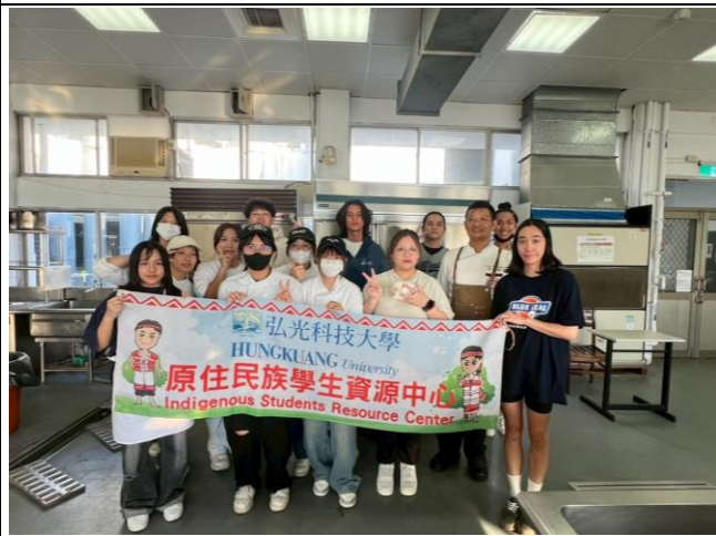
原住民族飲食文化推廣-馬告漢堡