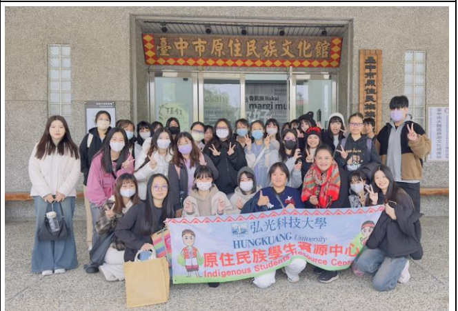
原住民族飲食文化與生活記憶