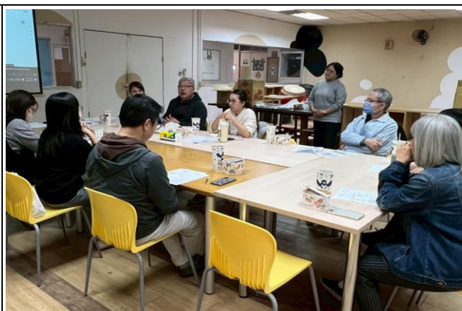
原住民族學生成績預警導師會議