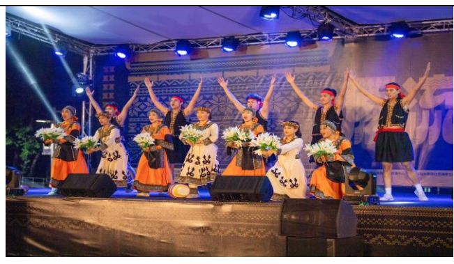
跨校樂舞交流-中區成果展