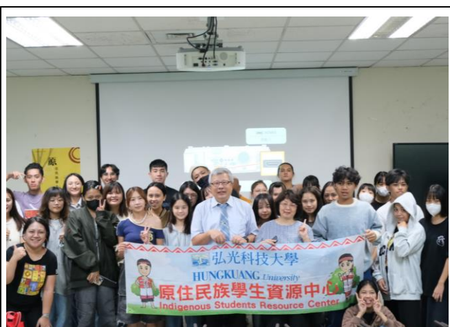
原住民族學生座談會-全體大合照