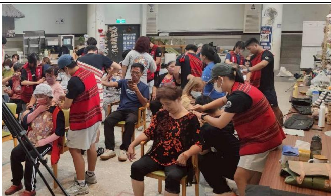
阿里山逐鹿社區-部落回饋