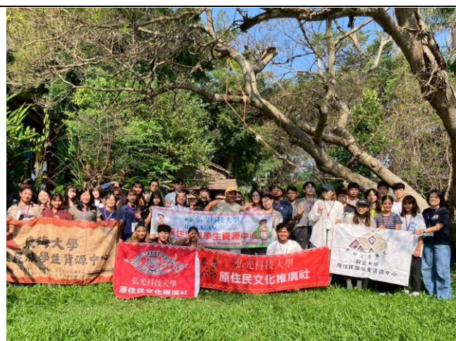
弘光、東海、靜宜全體大合照