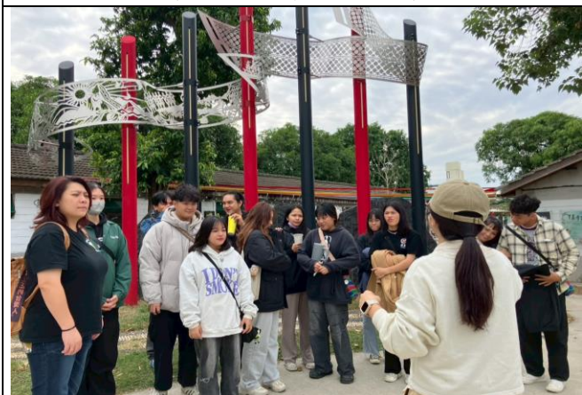
職場參訪體驗：原流新創