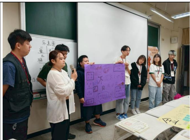
文化研習活動-探尋排灣族嫁娶風俗