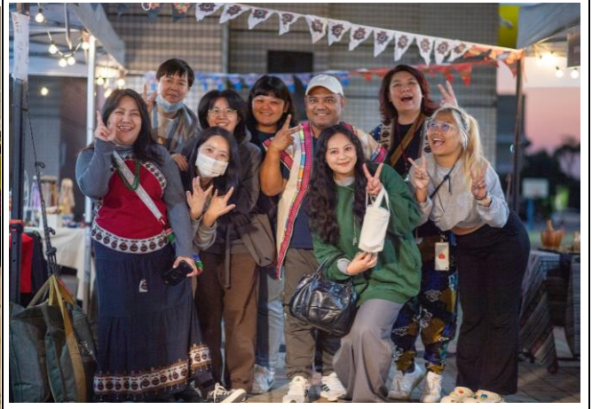
各校原資中心助理參與市集活動