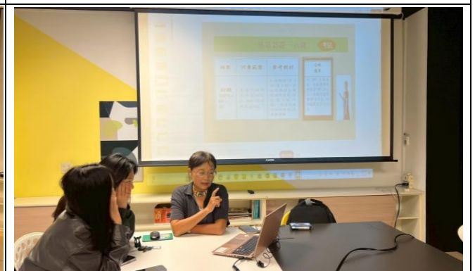
排灣語(初、中級)實體課程