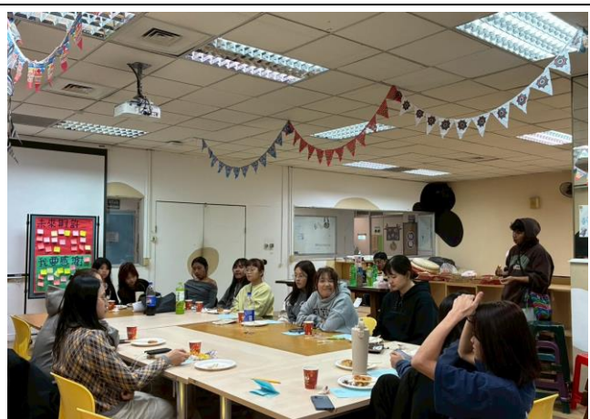
原住民族推廣社期末聚&自我認同活動