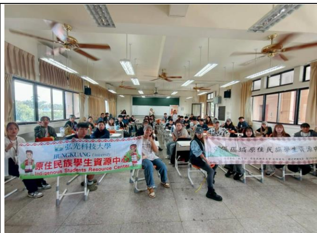
文化研習活動-探尋排灣族嫁娶風俗