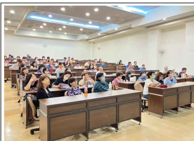
原住民族學生導師會議大合照