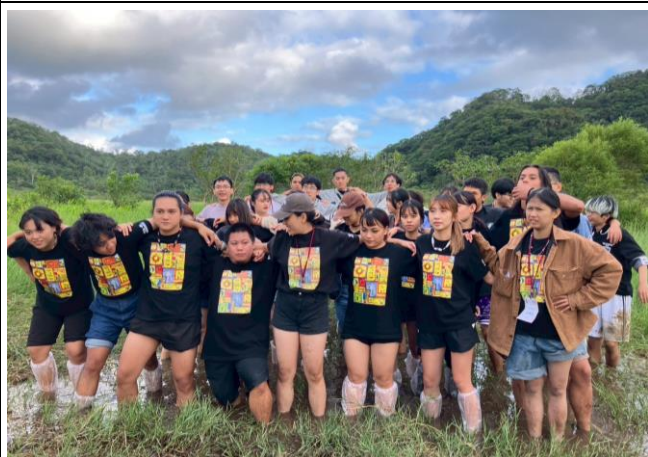
部落生態導覽-東源森林遊樂區