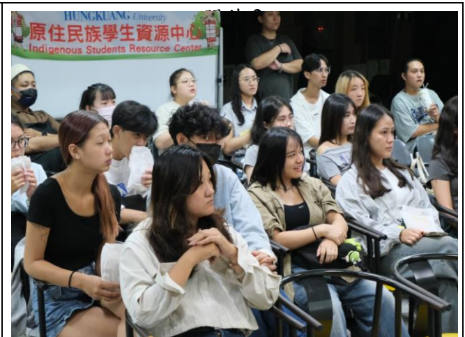
職涯工作坊課程中