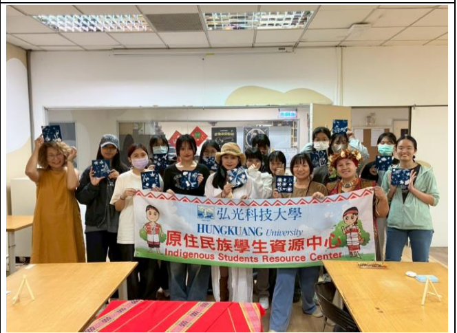
織染・植感 2.0：植物染畫布