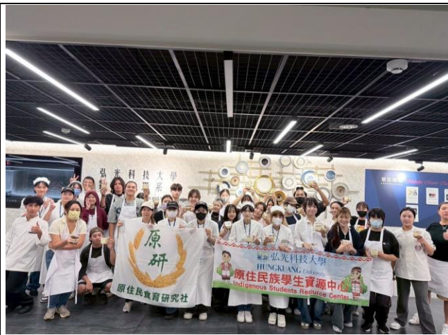
原住民族飲食文化推廣-小米提拉米蘇