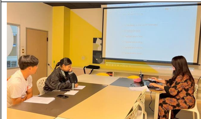
阿美語(初、中級)實體課程