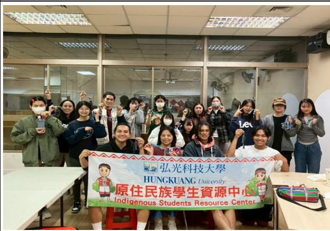
編織文化，感受賽德克之美