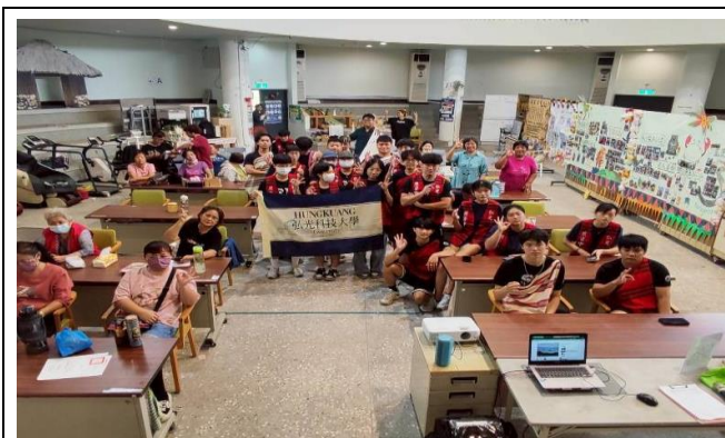
筋膜刀考照全體大合照