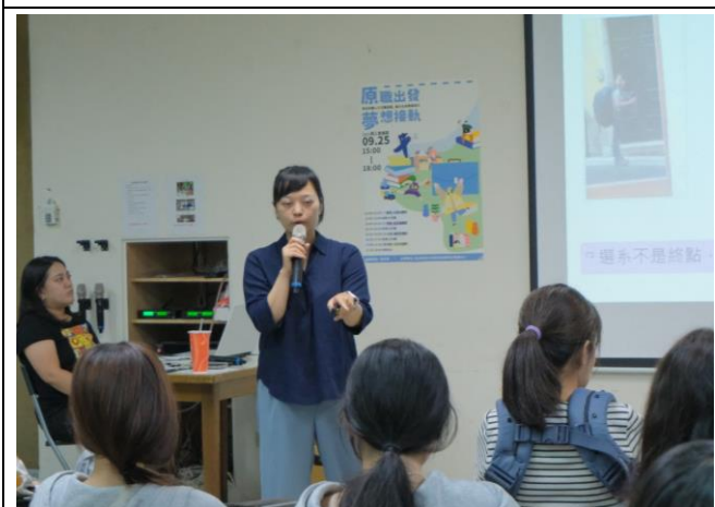
布農族講師-護理分享