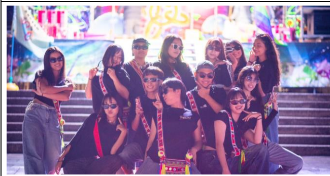
跨校樂舞交流-嶺東科大