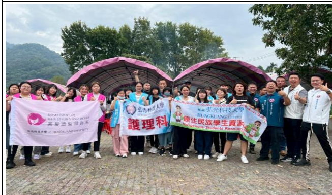
雙崎部落社區活動中心—大合照